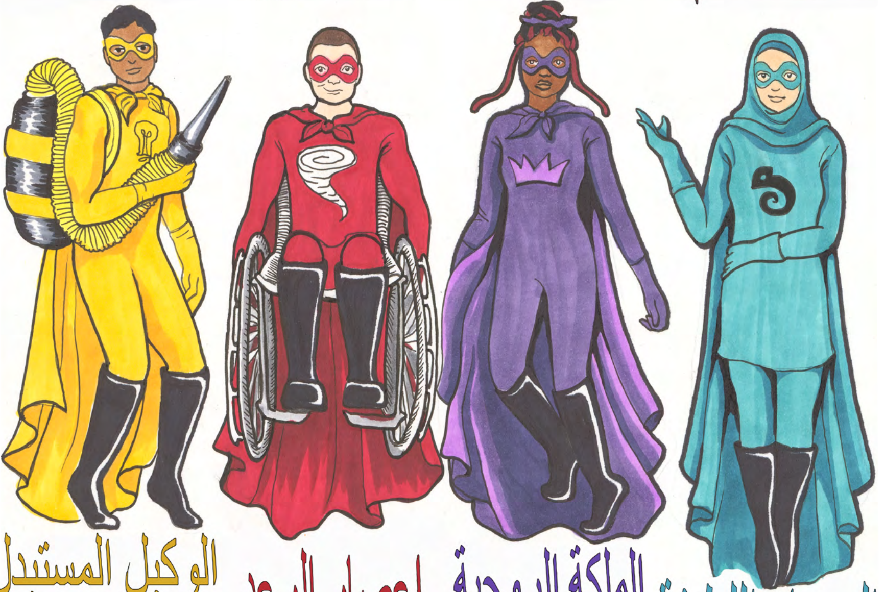
الحرباء اللطيفة الملكة الروحية إعصار الرعد الوكيل المستبدل