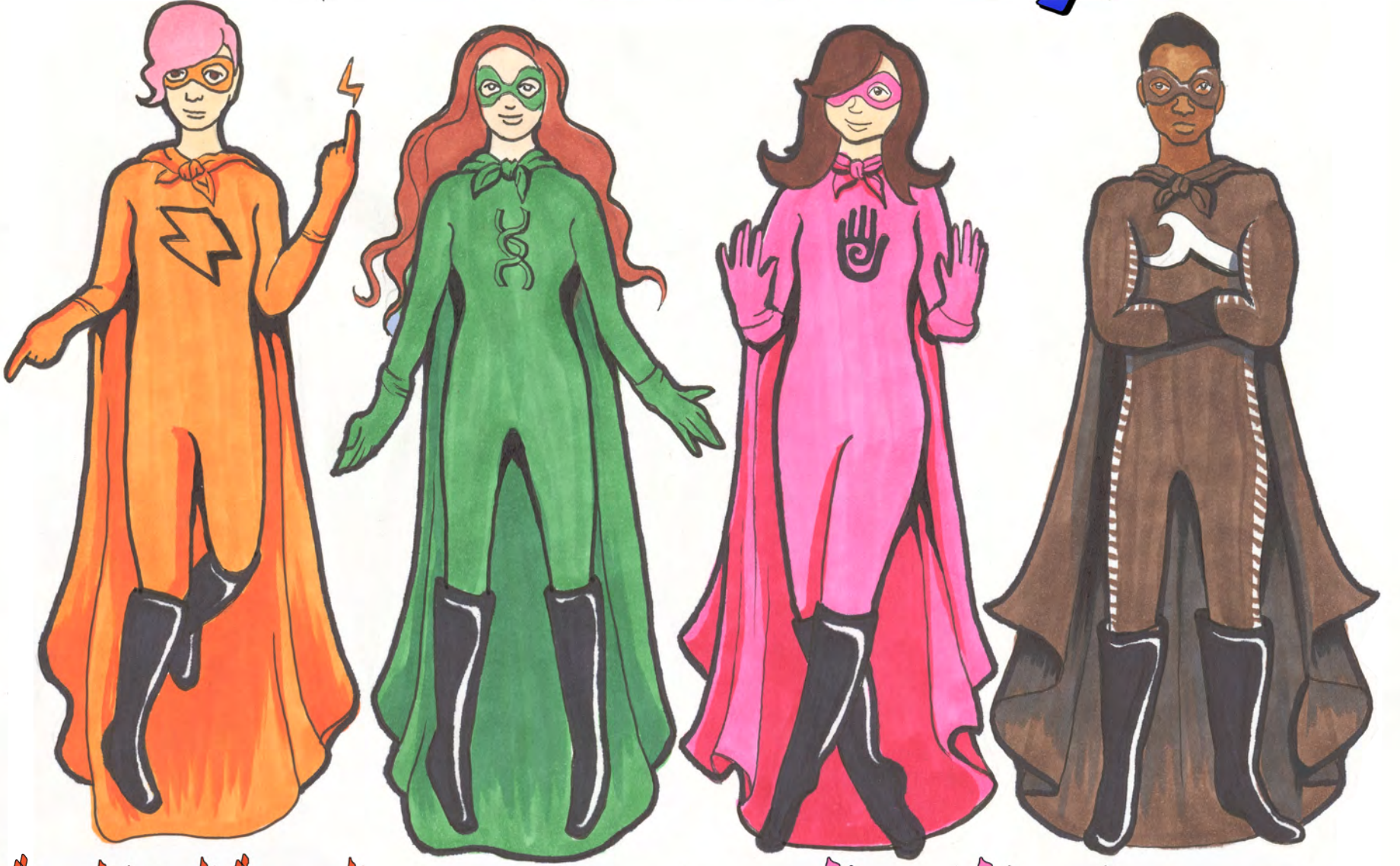
كابتن كالم المعالج الجمال المرن الصدمة المغناطيسية